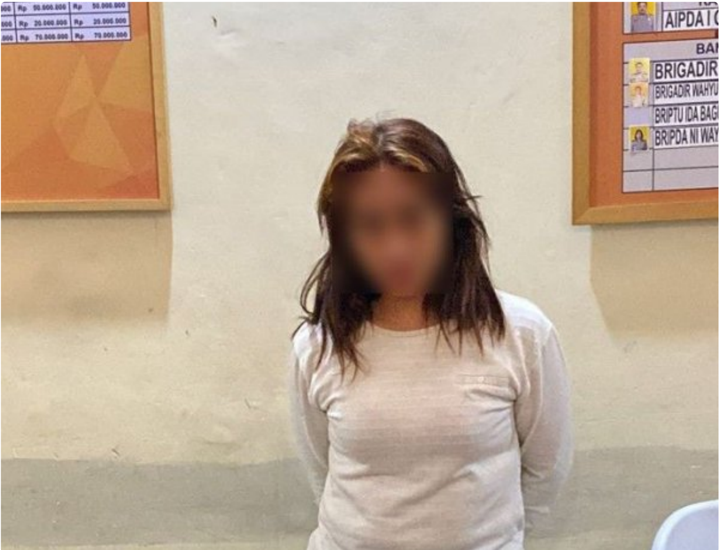
Tersangka pengedar sabu yang diamankan Sat Resnarkoba Polresta Mataram. (12/05/2024)

Mataram NTB - Seorang Ibu Rumah Tangga (IRT) asal Cakranegara terpaksa diamankan tim Opsnal Sat Narkoba Polresta Mataram di kediamannya di salah satu Kos-kosan di wilayah Cakranegara, Kota Mataram, Minggu, (12/05/2024) sekitar pukul 01 : 30 wita.